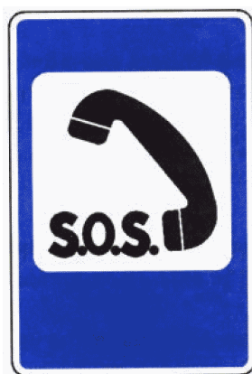
7.19 Телефон экстренной связи